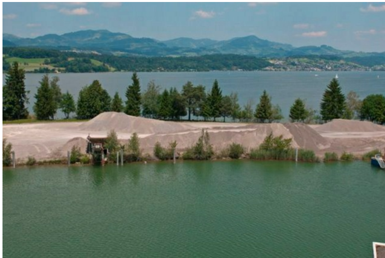
Attraktives Bauland an sensibler Stelle: Kibag-Gelände bei Wangen am Zürichsee.

Die Kibag wollte einen Teil des Zürichsees für den Bau von Luxuswohnungen und eines Bootshafens aufschütten. Die seit zehn Jahren dauernde Planung scheiterte an einer neuen Bestimmung.