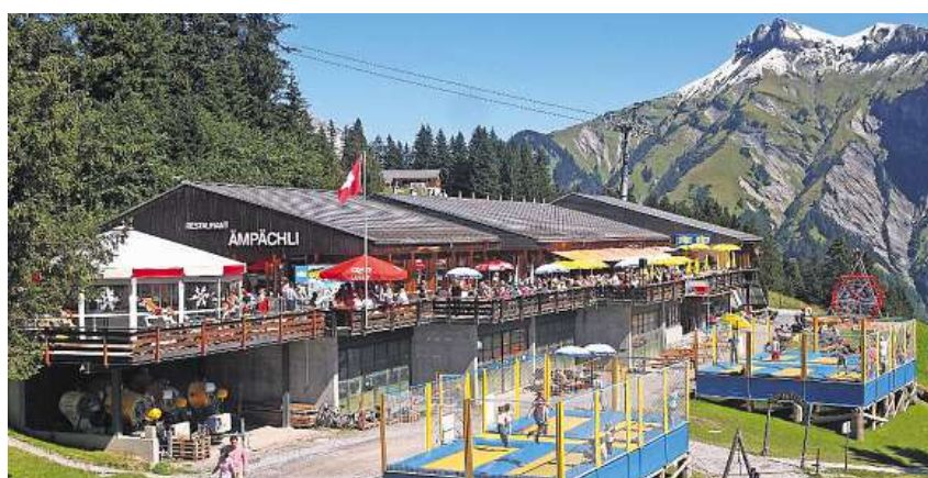
Die sonnige Terrasse lädt zum Schlemmen und Entspannen ein.

Das sonnige Bergrestaurant – entspannen Sie sich auf der Sonnenterrasse des Bergrestaurants «Ämpächli» und geniessen Sie die traumhafte Umgebung. Täglich feine Menüs und fri-