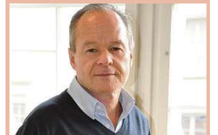
Von Bruno Hug

Unternehmen sichern Arbeitsplätze. Dazu ist Profit nötig. Damit diesem aber nicht alles untergeordnet wird, braucht es oft Gegendruck. Dafür gibt es in Sachen Umwelt Organisationen wie WWF oder Pro Natura.